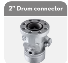
with integrated valve Code F17163000