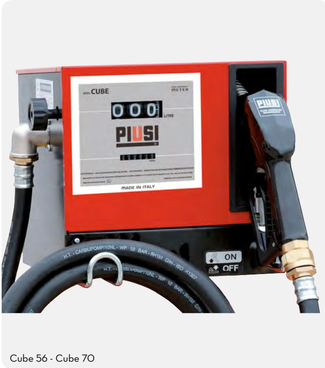
Cube 56 - Cube 70