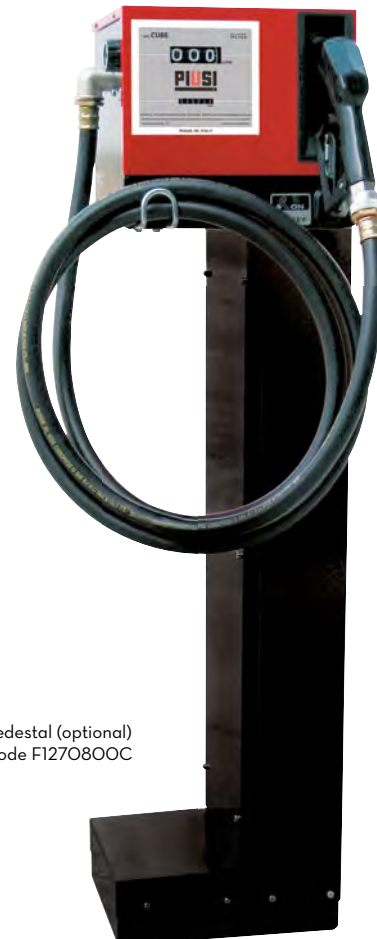
Pedestal (optional) Code F1270800C